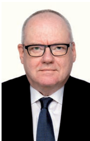
Seit vergangenen Oktober in Frankfurt am Main: Generalkonsul Markus Bienz

Es ist für mich ein grosses Privileg, nun erstmals in Deutschland tätig zu sein. Ich schätze es