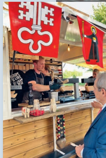
Kulinarischer Höhepunkt: Der Raclette-Foodtruck.