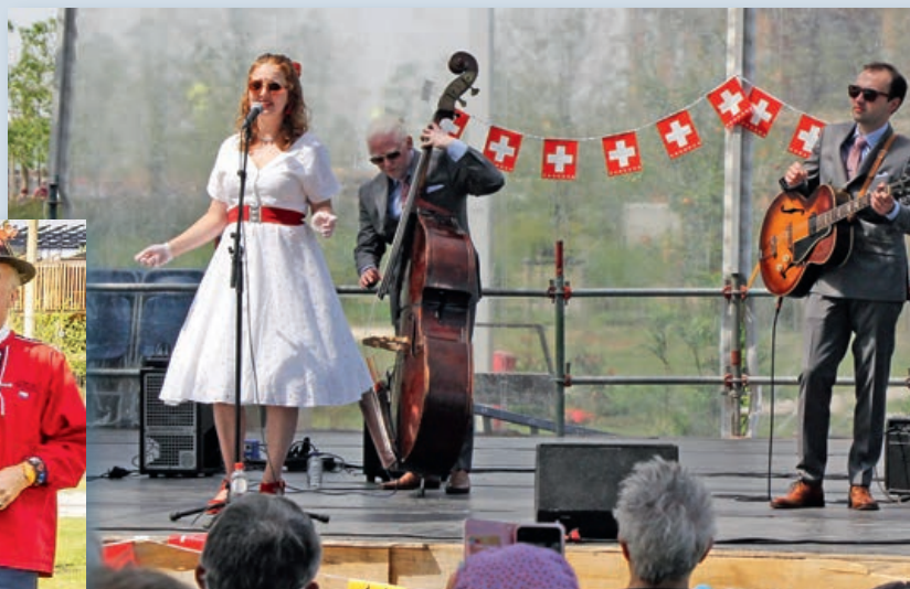
Sorgte für flotte Unterhaltung: die Schweizer Jazz-Band The Lipstick Killers..